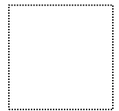
負責人印章 或代理人印 章或簽名